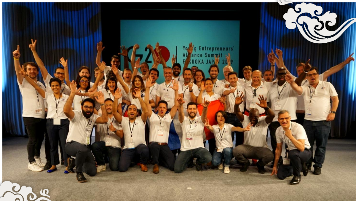
La Délégation Française du G20 des Jeunes Entrepreneurs 2019 à Fukuoka

Les Jeunes Entrepreneurs français entendent être des citoyens responsables et porteurs de solutions pour la croissance, l'innovation, l'emploi au service d'un avenir durable pour leur pays.